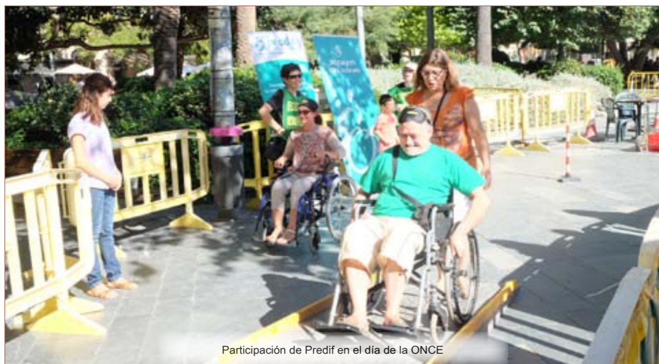
Participación de Predif en el día de la ONCE

Durante este año 2014 se ha colaborado con varios eventos organizados por otras entidades o personalidades del ámbito de la discapacidad: