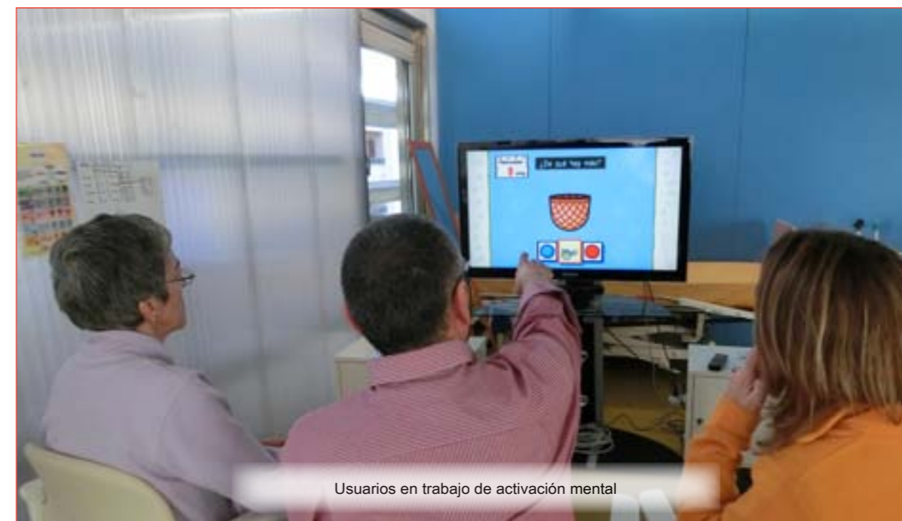
Usuarios en trabajo de activación mental

Las características metodológicas del SEPAP, de probada efectividad, innovadoras a nivel nacional y en la línea del espíritu de la Ley de la promoción de la autonomía personal, nos ha permitido acer-