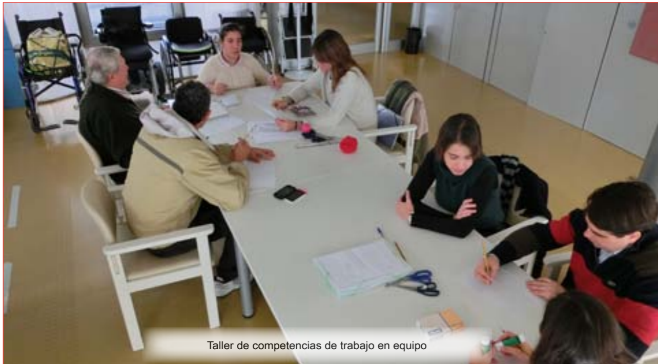
Taller de competencias de trabajo en equipo

te disfruta de un contrato fijo y ha resultado una experiencia ejemplar que llegó a inspirar la publicación de una entrevista al usuario que fue colgada en el apartado “noticias” de la web territorial de INCORPORA. En este sentido será muy importante disponer de canales de acceso específicos a programas formativos para poderlos poner a disposición de nuestros usuarios.