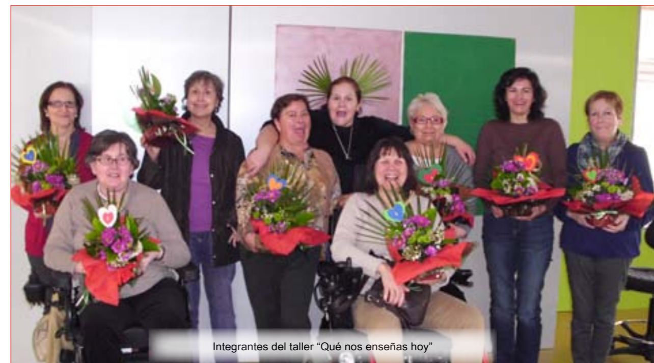
Integrantes del taller "Qué nos enseñas hoy"

de itinerarios accesibles...), fomento del uso de Tecnologías de la Información y Comunicación (TIC), etc.