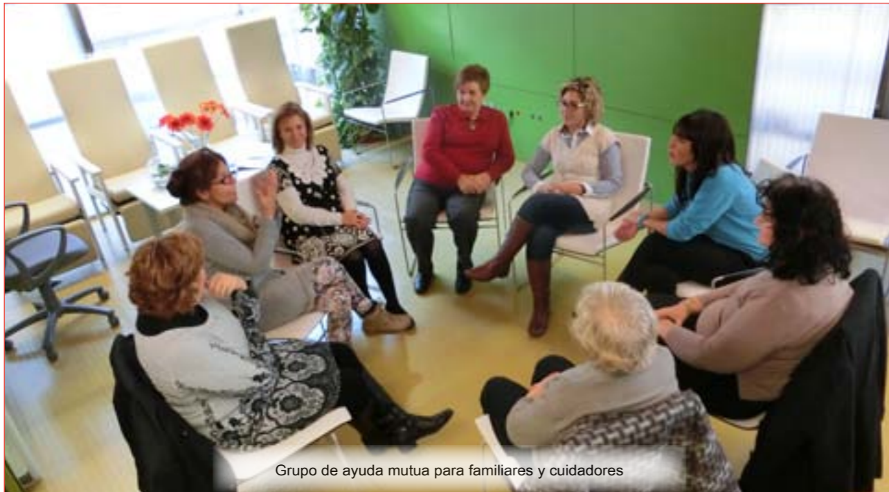
Grupo de ayuda mutua para familiares y cuidadores