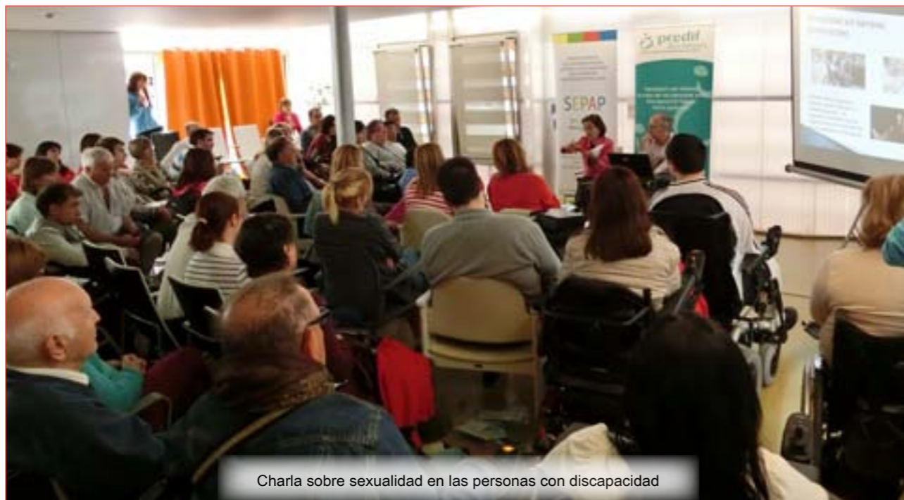
Charla sobre sexualidad en las personas con discapacidad

promoción de la autonomía personal, sino para reconducir todo tipo de demandas relacionadas con la discapacidad física.